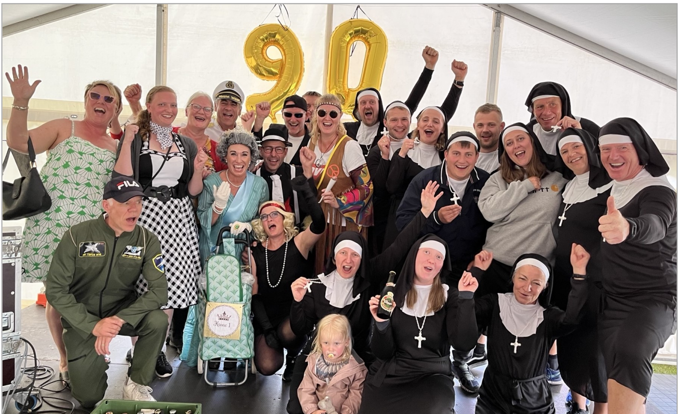
Gadeholdene fra Lillevorde Kær og Stadionvej vandt 6 kamp i 2023